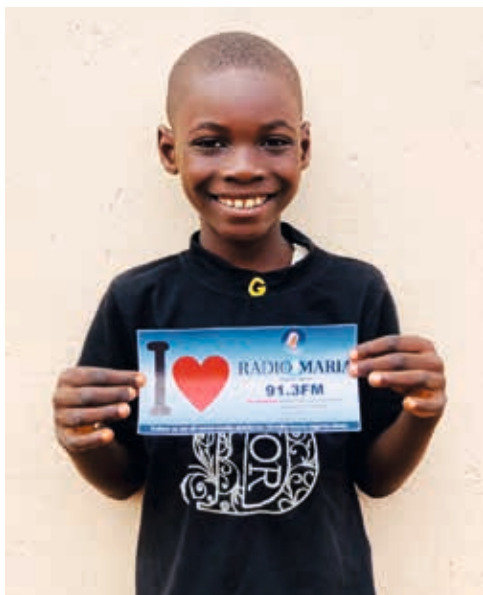
Radio Maria Nigeria

Spenden bitte mit dem Verwendungszweck: MARIATHON