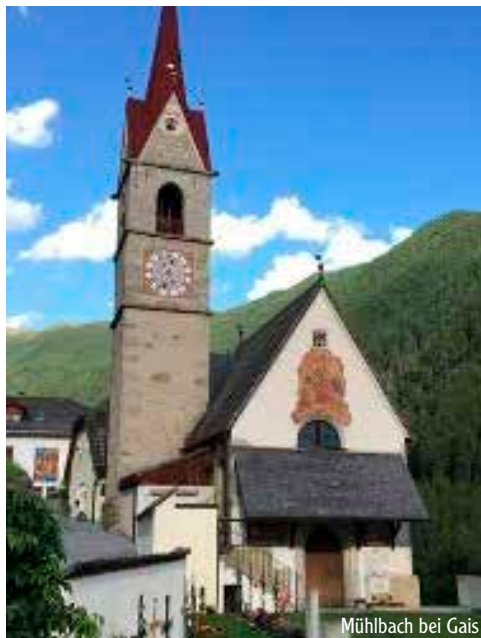
Mühlbach bei Gais