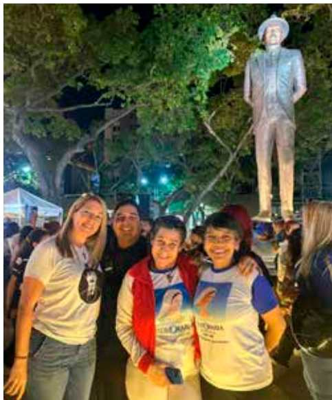
Radio Maria Venezuela

Nähere Informationen, die aktuelle Mariathon Broschüre und Videos aus der ganzen Welt gibt es auf www.radiomaria.bz.it