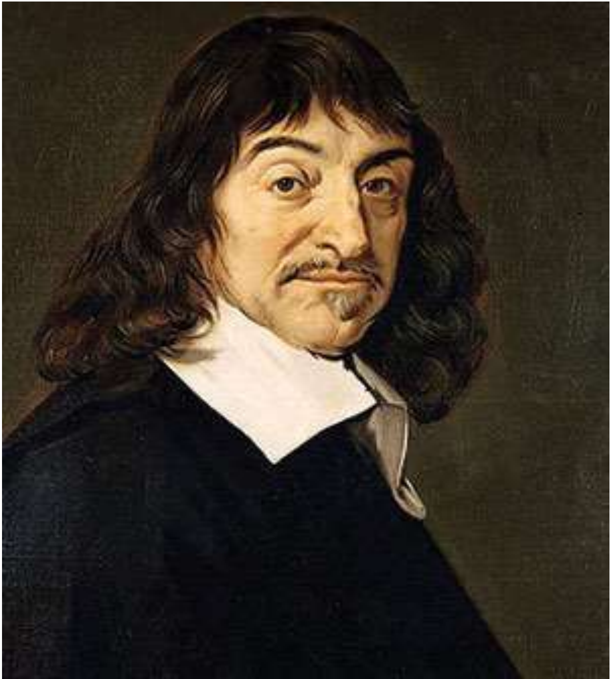
RENE DESCARTES (1596-1650)