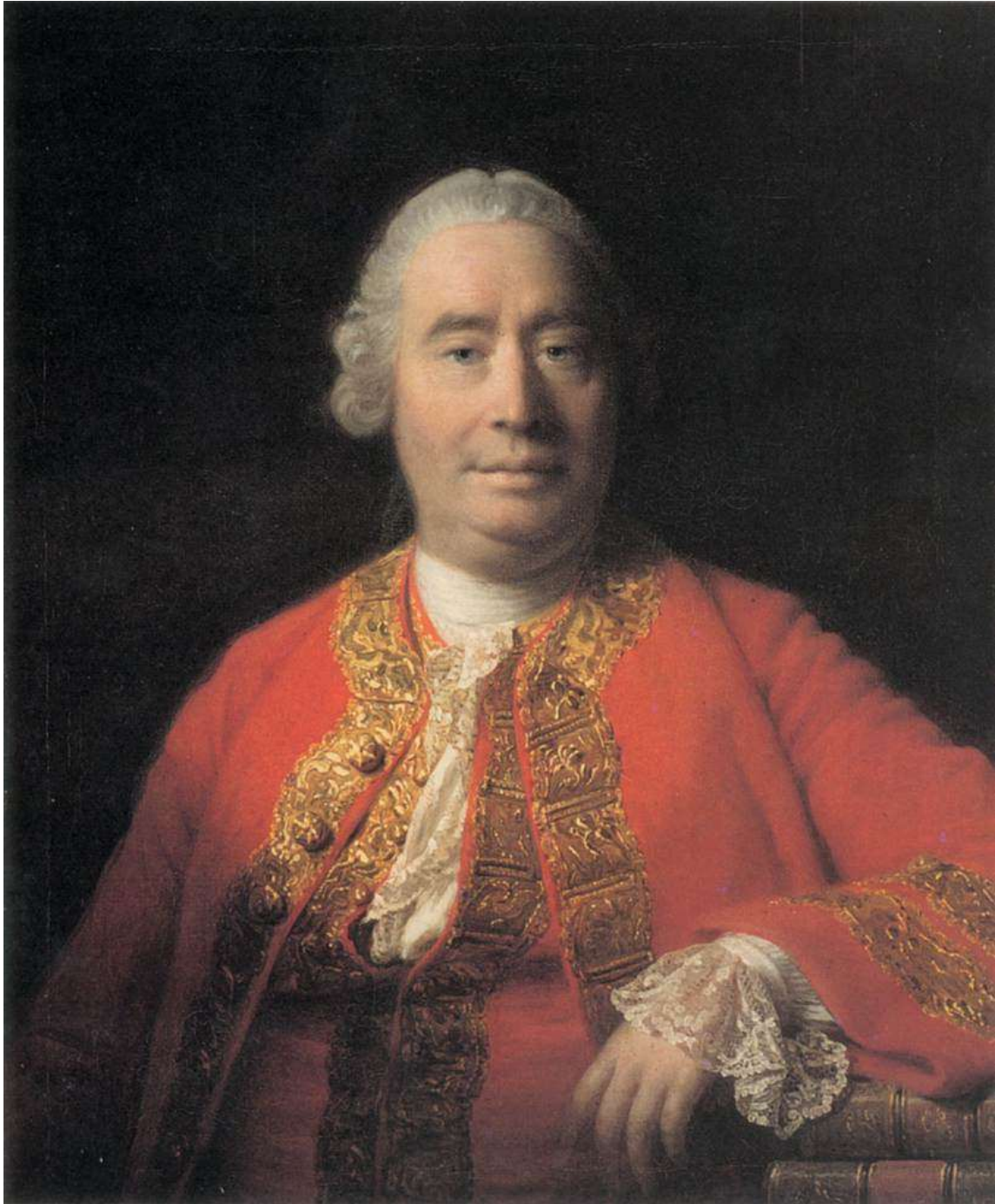
DAVID HUME (1711-1776)