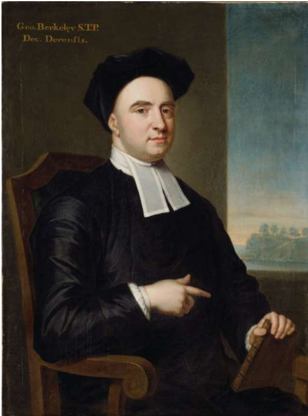
GEORGE BERKELEY (1685-1753)