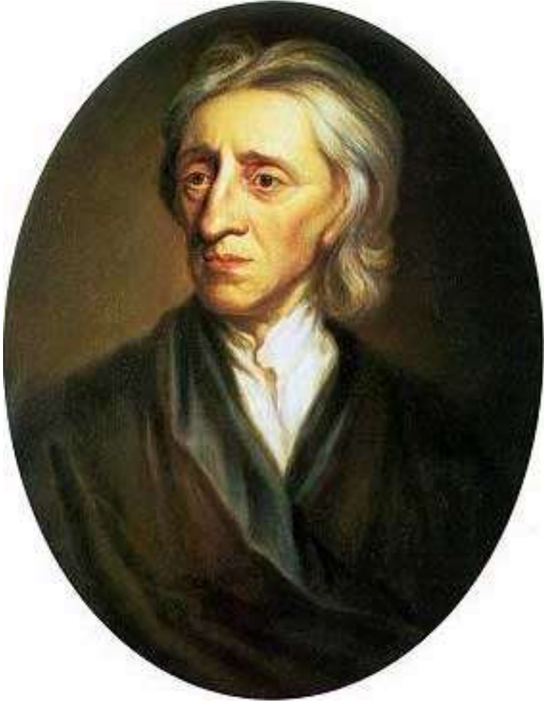
JOHN LOCKE (1632-1704)

"Epistola de tolerantia" ("Briefe über Toleranz") (1689)