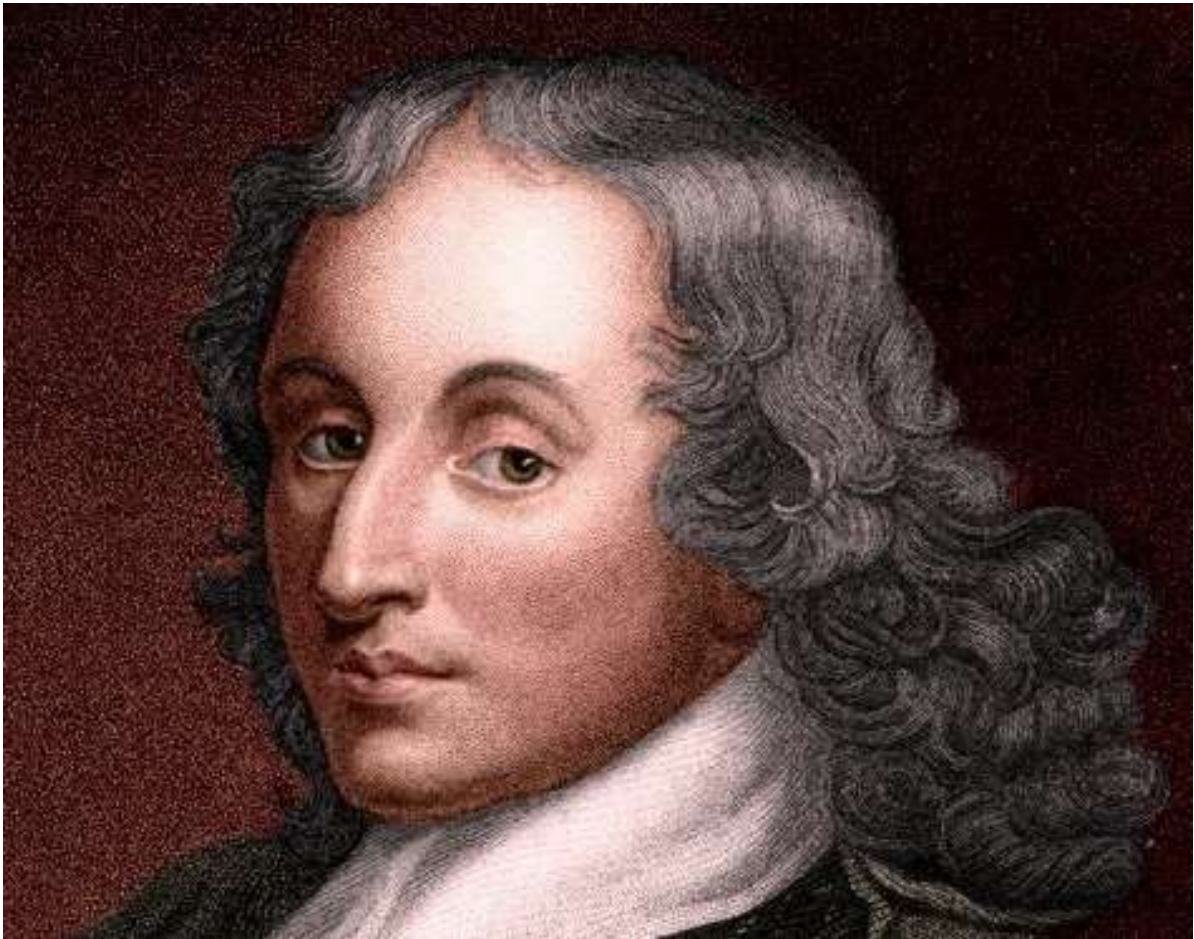
BLAISE PASCAL (1623-1662)