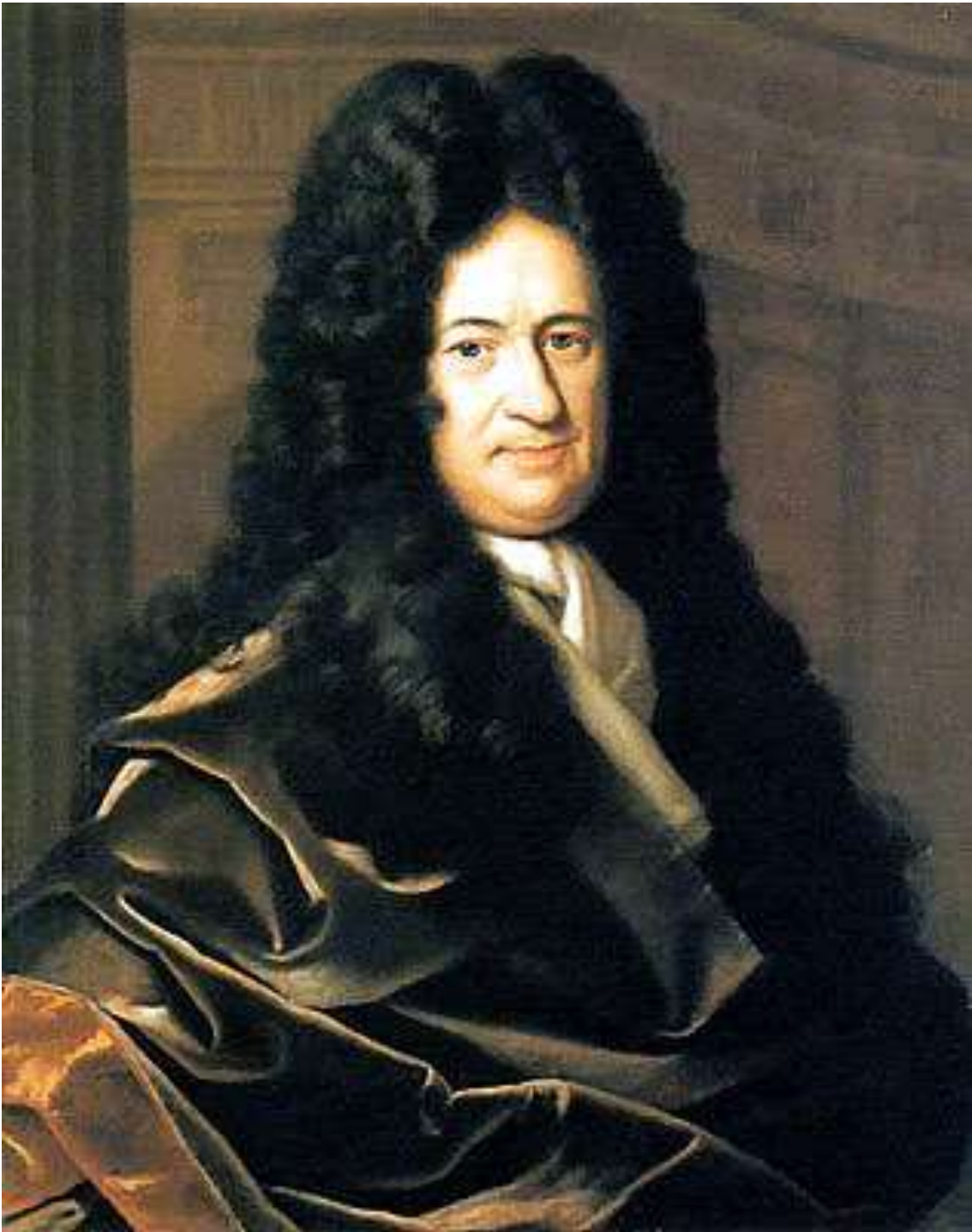
GOTTFRIED WILHELM LEIBNIZ (1646-1716)