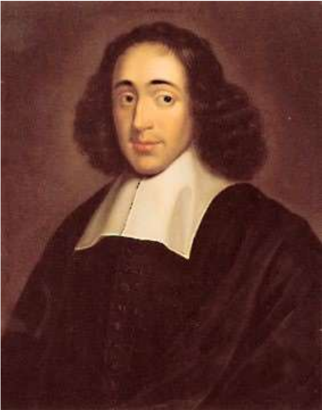
BENEDICTUS SPINOZA (1632-1677)